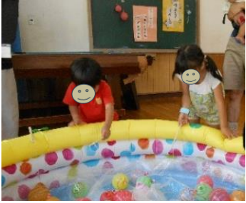
夢中で取った ヨーヨー釣り♪