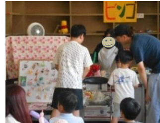
地域の方と楽しんだビンゴ大会！ お気に入りの景品をゲットできたかな？