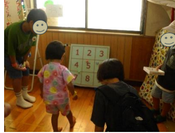
ニュースポーツのソフトダーツを楽しみました♪ 小学生は高得点をねらってがんばりました！