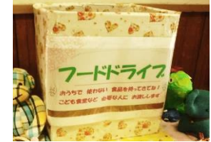
詳細は南郷児童館までお問い合わせいただくか、館内の掲示をご覧ください。

ポテトさんのバルーンショーやマジックショーがありました。大きなバルーンを見て『何ができるんだろう』とワクワクしたり手品にドキドキしたり。皿まわしにも挑戦してみたりと、とっても楽しい時間でした。