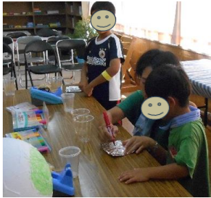
ココロコ不思議な動きを楽しめる恐竜のたまご作りをしました

子ども達が準備を重ねて楽しみにしてきた南郷児童館なつまつり。南郷児童館の50周年記念のお祝いということもあり、例年に増して盛大に行われました。50年という歴史のある児童館。これからも子ども達の笑顔あふれる児童館でありますように。