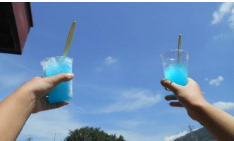
暑い日のかき氷おいしかったね！

子ども達が準備を重ねて楽しみにしてきた南郷児童館なつまつり。南郷児童館の50周年記念のお祝いということもあり、例年に増して盛大に行われました。50年という歴史のある児童館。これからも子ども達の笑顔あふれる児童館でありますように。