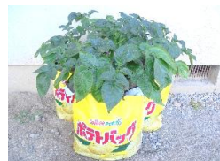
じゃがいも沢山とれるといいな〜

西日が当たるので熱中症対策を引き続き取りつつ、地球にやさしい使い方を子ども達と考えながら使用していきたいと思います。