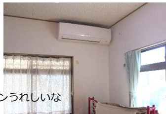
ピカピカのエアコンうれしいな