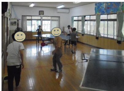
卓球もできるよ！はじめての人も挑戦してみよう。