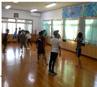
ドッジボールも楽しいね