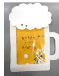
かわいいカードができました！